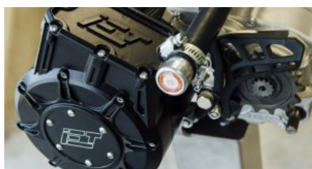
Un power train di S.M.R.E.

ha sviluppato pacchi batterie di ultima generazione con tecnologia agli ioni di litio. Quello della green mobility è un settore dal potenziale infinito: se coi motori a combustione le barriere di ingresso sono elevatissime (lo stampo industriale di un motore classico costa circa un miliardo di euro) e servono di conseguenza economie di scala con numeri a sei cifre, nel mondo elettrico i costi sono decisamente inferiori . Mentre aumentano infinitamente le possibilità e ne guadagna la competitività.